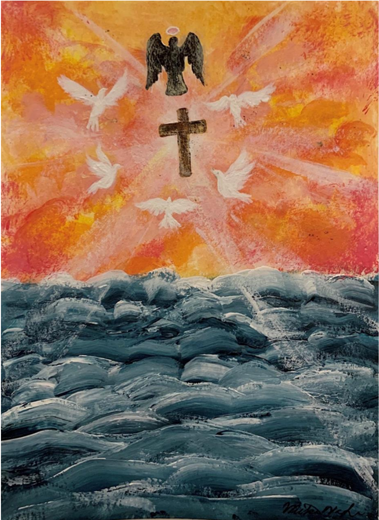
“Spirits lead me where my trust is without borders” by Mikuli (age:17)

Mikuli created this artwork, inspired by a song “oceans (where feet may fail)” - “Spirits lead me where my trust is without borders, let me walk upon the waters wherever you will call me.”